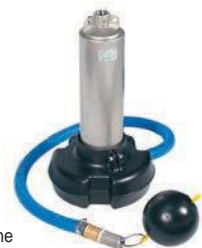
Pumpenfuß für 5" Pumpen, Möglichkeit zur schwimmenden Entnahme