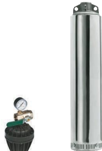
Anschluß Kit Pres Darstellung enthält optionales Zubehör, Kit-Press im Preis enthalten.